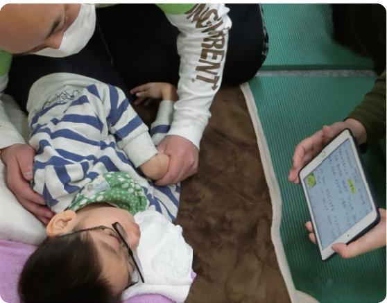
(タブレットで読書を楽しむ キッズサポートリマ)